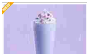
AdmirorGallery 5.0.0, author/s Vasiljevski & Kekeljevic.