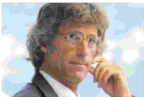
PASTA Guido Maria Barilla