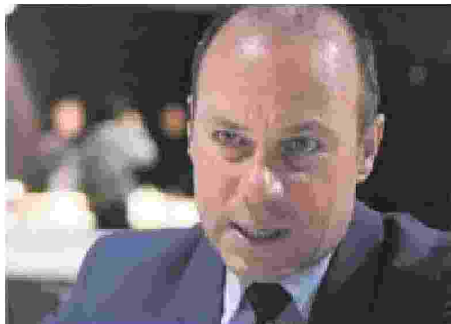
CAFFÉ Giuseppe Lavazza